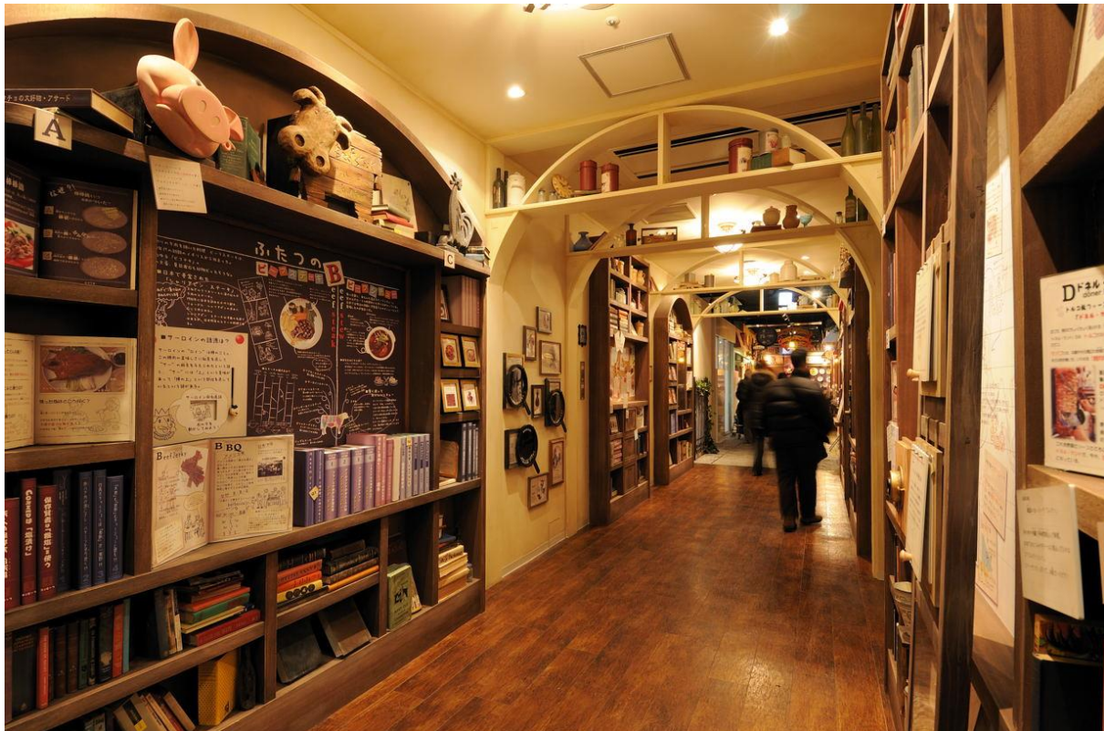
《東京ミートレア お肉のミュージアム》