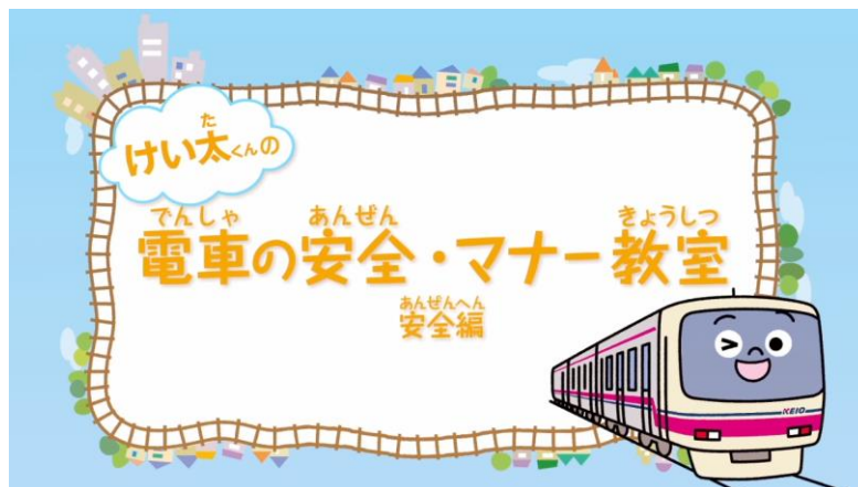
《「けい太くんの電車の安全・マナー教室」動画 オープニングページ》