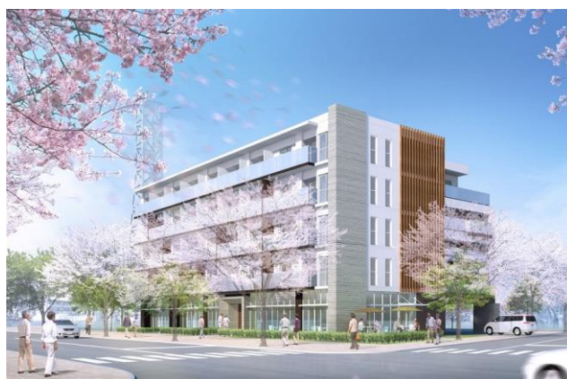
《スマイラス聖蹟桜ヶ丘（イメージ）》