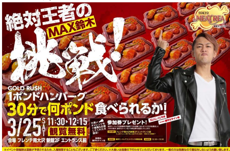
《ポスターイメージ》