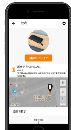
《お客様への通知イメージ》