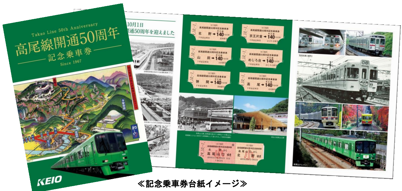
《記念乗車券台紙イメージ》